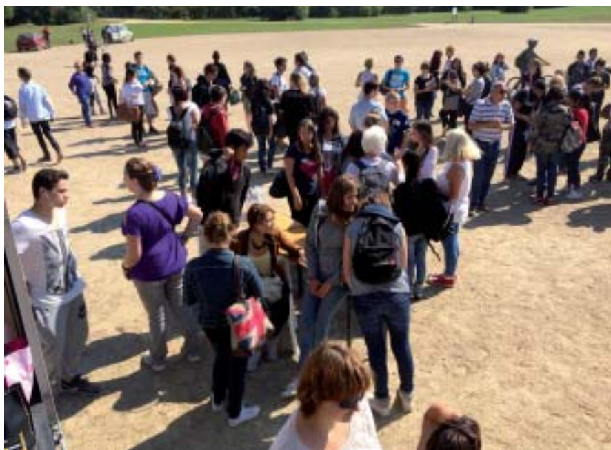
Après la course d'orientation urbaine, les équipes se retrouvent.