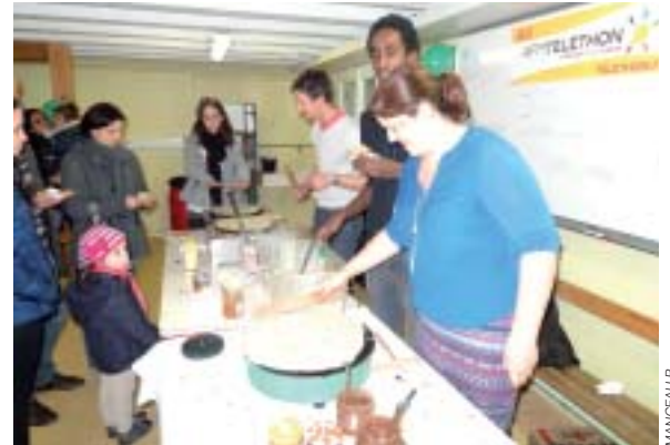
Par ici les bonnes crêpes!