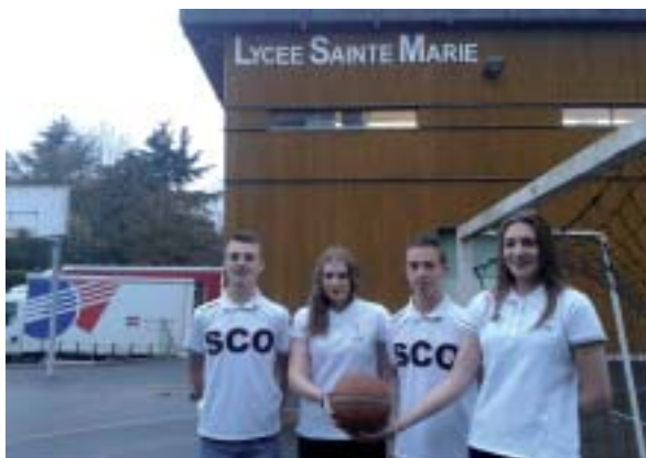
Les 4 jeunes doivent concilier sport et passion du ballon rond.

R. : En U17 élite, niveau régional, il y a le FC Nantes. A. : En U17 nationaux, il y a