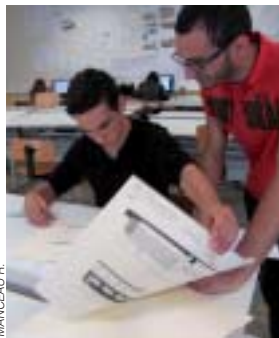
Sur le site Saint Serge, l'offre de formations comporte notamment la filière bâtiment/architecture.

C'est seulement une question de place. Un terrain se trouvait plus près du site Sainte Marie pour la construction des nouveaux bâtiments.