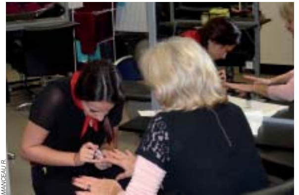
Pose de vernis par les lycéennes esthéticiennes.