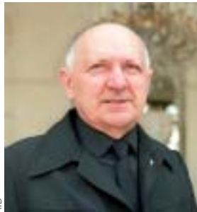
Wresinski, fondateur d'ATD Quart Monde.

Tout d'abord, le fait que Joseph Wresinski était originaire d'Angers, qu'il était de religion ca-