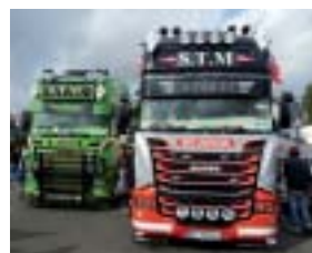
Deux camions Scania décorés de l'entreprise S.T.M.