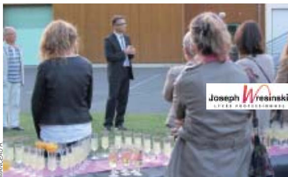
Soirée partenariat annonçant la fusion de nos établissements.

Un grand merci aussi à celles et ceux qui ont participé activement à l'accompagnement de ces jeunes, pour les révéler, pour faire émerger leurs talents, pour donner de nombreuses informations aux membres de la communauté éducative du lycée. Que dire de plus ? Nous sommes lancés dans une nouvelle aventure, avec nos textes fondateurs respectifs, très proches l'un de l'autre, prônant l'accueil de tous,