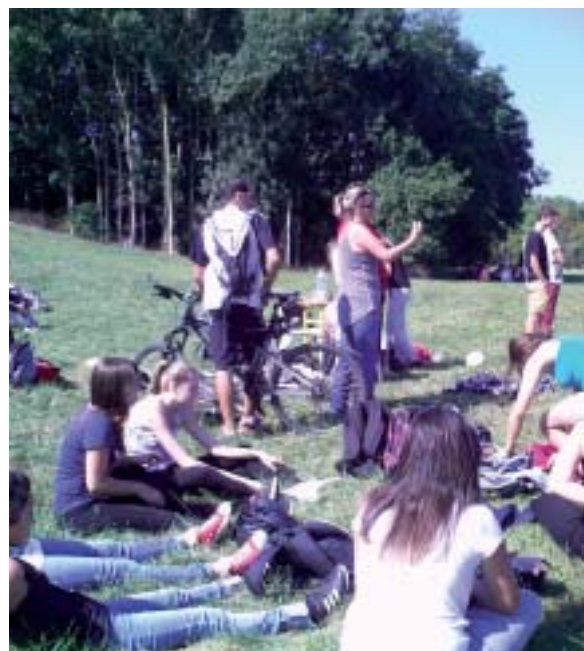
Après l'effort sportif, pause relaxante sur les pelouses du Lac de Maine.