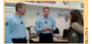
Après la conférence, des échanges de façon plus personnelle.