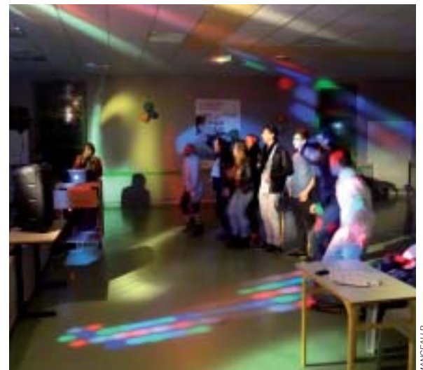
Ambiance lors de la soirée karaoké.