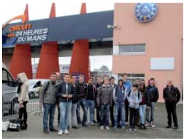
Le groupe des CRM1 à l'entrée du circuit Bugatti.