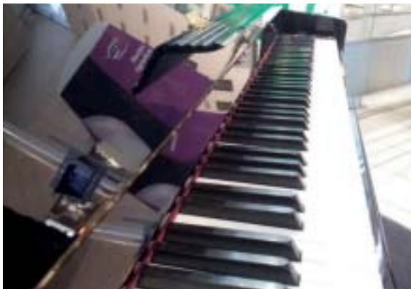
Le piano à la gare d'Angers est installé depuis bientôt un an.

Depuis près d'un an, la gare d'Angers Saint-Laud participe au projet « piano en gare » intitulé : À VOUS DE JOUER !