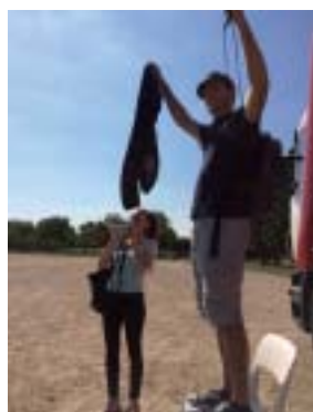
Le mégaphone est nécessaire pour donner les instructions.

Diverses activités étaient ensuite proposées : les élèves ont pu s'affronter lors d'un baby-foot humain, beach soccer, balle aux prisonniers, relais VTT, etc. Si cette journée a eu lieu, c'est grâce à l'équipe