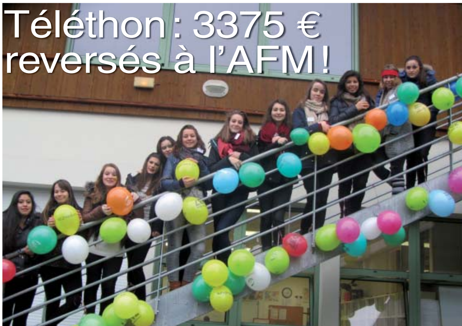
Le projet « 24h à l'abordage de tous les défis » a impliqué élèves, professeurs et personnels du lycée.