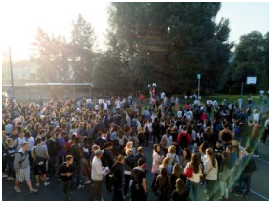
Le regroupement des élèves au lycée lors du départ le matin.