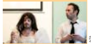
« C'est un métier d'homme » de et par Denis Fouquereau et David Migeot.

Dans le cadre du jumelage avec le Nouveau Théâtre d'Angers, nous avons assisté à la pièce « Un métier d'homme ». Elle évoque une histoire revisitée de façons différentes. « J'ai voulu commencer par cette pièce pour faire plaisir aux élèves, explique le professeur de français. Ce qui est intéressant dans l'activité, c'est le mode d'évasion procuré, c'est aussi une grande ouverture culturelle vers des univers très différents de notre quotidien. J'espère que les élèves apprécieront les autres pièces que nous aurons l'occasion d'aller voir grâce au jumelage. » De l'avis d'un élève de 2SPVL « Beaucoup de rires et de plaisirs grâce à la proximité des acteurs. La pièce était une réussite et une grande partie de la classe a apprécié.