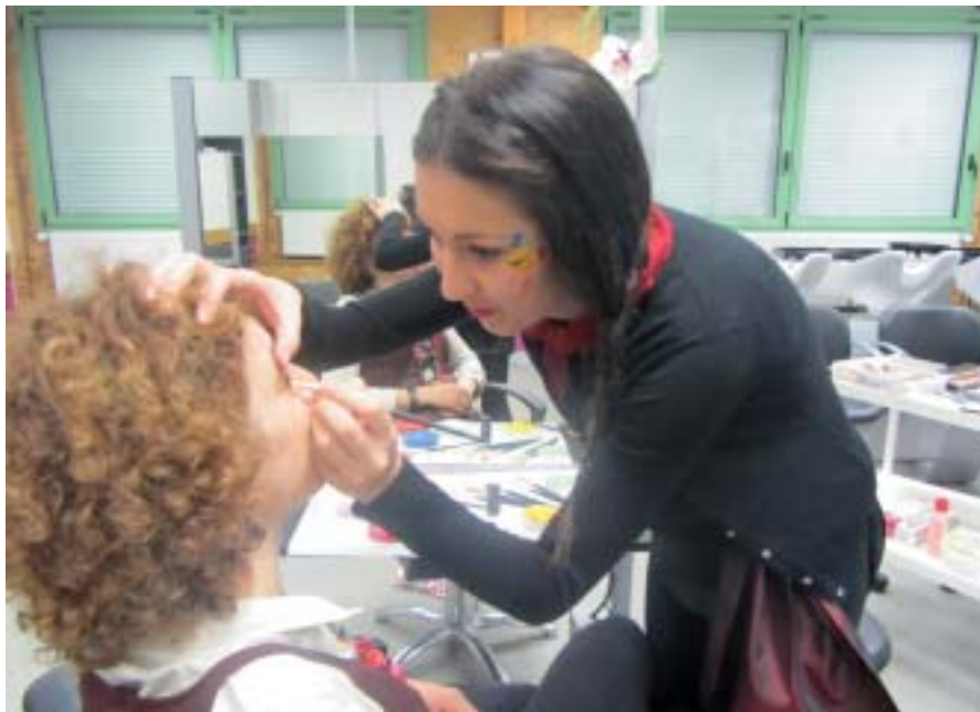
Maquillage effet bonne mine garanti: utile pour tenir le défi 24h non stop!