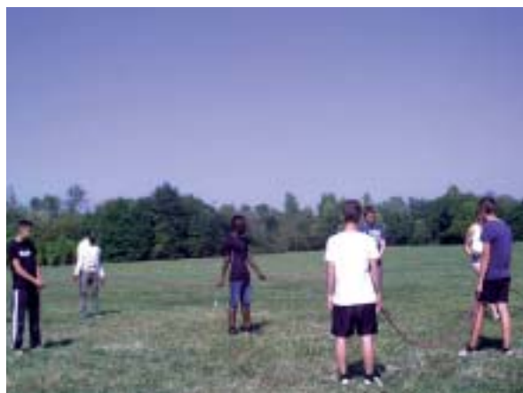
Le soleil a été un des acteurs de la réussite de cette journée.