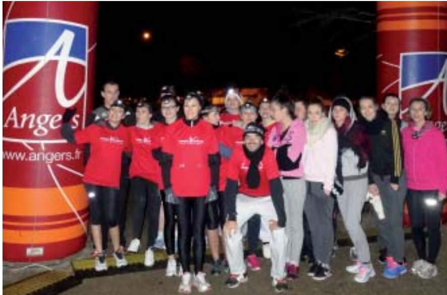
Défi à l'étang Saint-Nicolas: course et marche à pied.