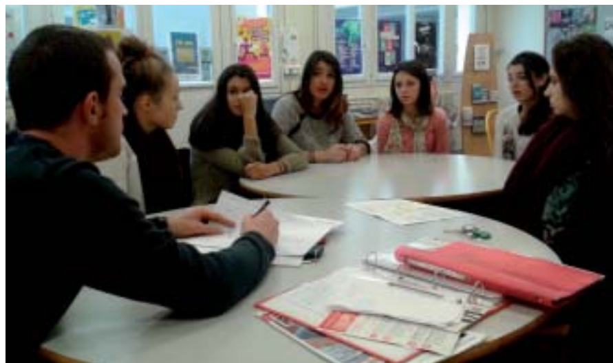
Discussions autour du thème de la mobilité pour nos futures jeunes conseillères régionales.

Les prochaines échéances pour le groupe de jeunes conseillères régionales auront lieu au printemps 2015 avec la rencontre des politiques.