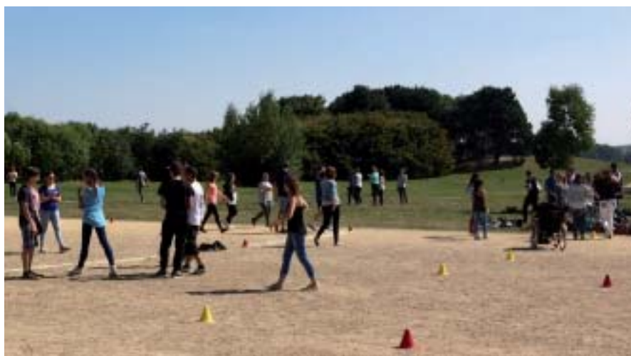
Des ateliers sportifs ont permis aux élèves de faire connaissance.