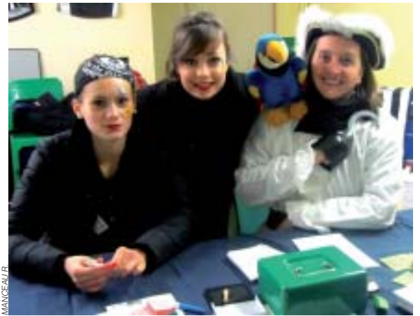
Petit passage par la caisse avant de participer aux animations.