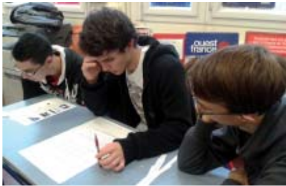
Suite à la conférence, les élèves de 2 LT ont travaillé sur le thème en éducation civique.